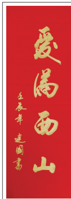
爱满西山(书法)作者:薛建国 (作者单位:万隆公司)