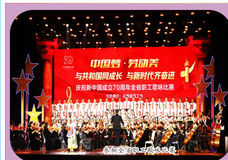
参加全商职工歌咏比赛