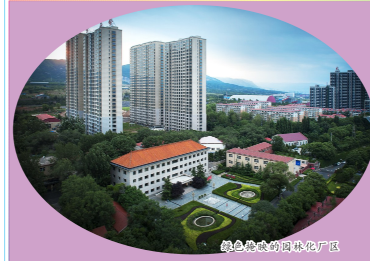
绿色掩映的园林化厂区