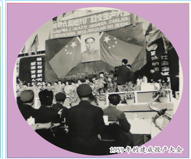
1959年的建成投产大会