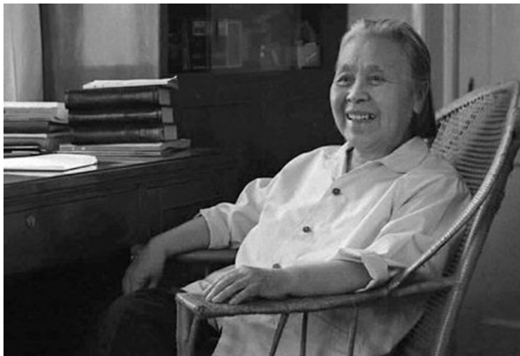
丁玲,原名蒋伟,字冰之,湖南临澧人,毕业于上海大学中国文学系,中共党员,著名作家、社会活动家。代表著作有处女作《梦珂》,长篇小说《太阳照在桑干河上》《莎菲女士的日记》,短篇小说集《在黑暗中》等。

一年来,我持之以恒坚持下来的一件重要之事是晨跑。说起我能坚持下来的原因,还得从我表弟谈起。去年腊月的一天,刚30出头的表弟工作时突然间摔倒昏迷不醒,送医院检查后才知道是脑出血,经过大夫几个小时全力以赴的抢救,暂时脱离危险但没有苏醒过来。如今一年过去了,表弟依然没有醒来,每日靠打