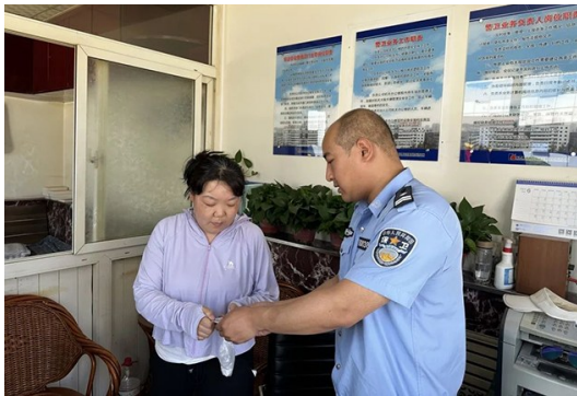
“你好，同志，我刚在附近捡到了一张社保卡”

卡……”6月30日上午，武装保卫信访中心警卫业务部门队员在日常站岗执勤工作时接到路人求助称，在机关办公楼附近捡到一张社保卡，由于还有其他事情需要办理且无法获得失主联系方式，所以希望警卫人员将拾得物