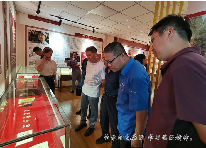
传承红色基因 学习工匠精神。

在2016年的关闭停产、转岗分流的中心工作中,白家庄矿业公司做了大量的工作:成立起矿井关闭分流领导小组,设置“生产回收管理组、资产管理组、人员队伍分流安置组、成本测算组、政策宣传组、多经管理组”六个小组推进工作;加强宣传思想政治工作,2016年每月1号的干部大会上,5个月都把“转岗分流”作为主题,统一思想、统一口径、统一办法。积极传达上级“煤炭去产能”的方针政策,弘扬主旋律,传播正能量;在山西焦煤、西山煤电和兄弟单位的帮助、支持下,组建专业队伍,发挥自身特长和优势,外出劳务输出;认真实行“双向选择”,主要做法就是队长书记选择工人,工人也选择单位,机构重组优化,不仅实现了减人提效目标,明显提高了职工的危机意识和敬业精神;积极做好和解决“一人一事”思想工作和实际困难,有力地推