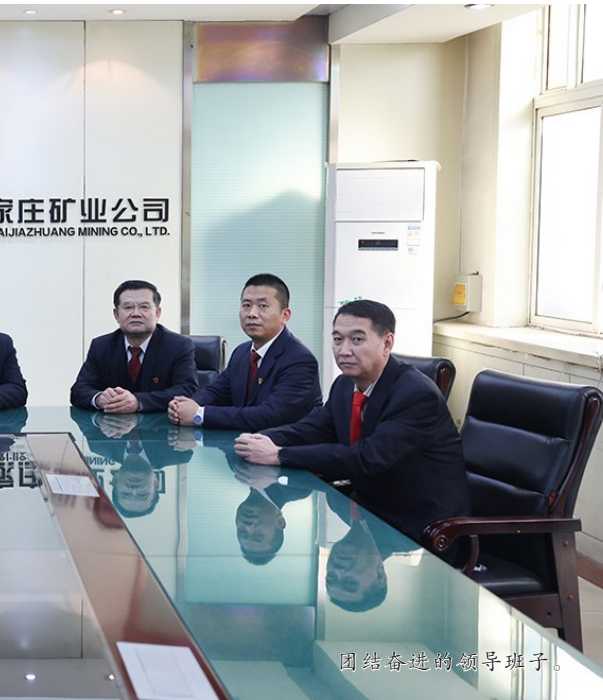
团结奋进的领导班子。

谷雨春光晓,山川黛色青,星子闪着光,微风带着甜,春夏在这里交接,灿烂在这里启程,从嫣然到明媚,一场春雨,