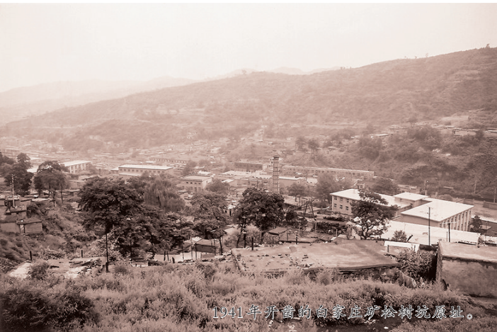
1941年开凿的白家庄矿坑竖坑遗址。