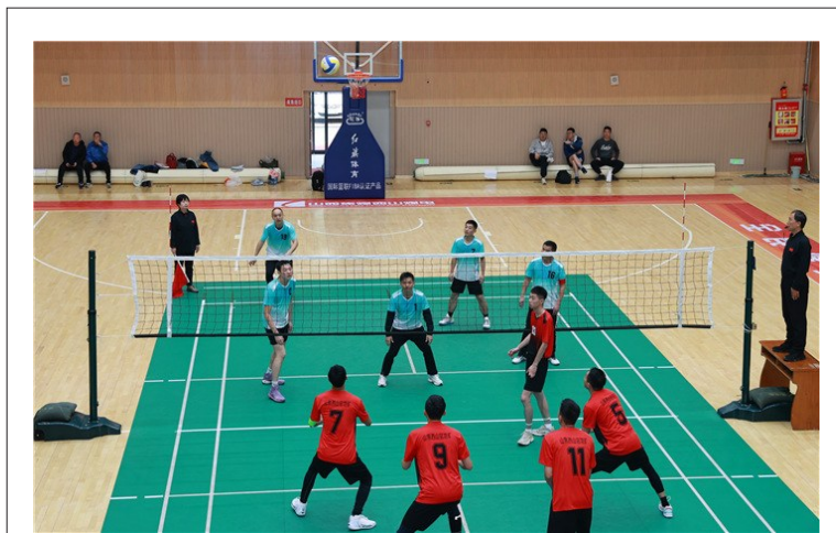
10月16日至17日,山西焦煤西山煤电“煤海奋斗杯”职工气排球赛在西山工人体育馆举办,所属单位的100余名职工组成的9支队伍参加。赛场上,大家精神抖擞、斗志昂扬,团结协作、奋勇拼搏,展示风采。 ●温洁

会上,杜儿坪矿、马兰矿、屯兰矿、三交煤矿分别汇报井口供暖改造进展情况;调度指挥中心对2024年度“雨季三防”工作进行了总结,并重点安排了2024年“冬季三防”工作。 ●张衡