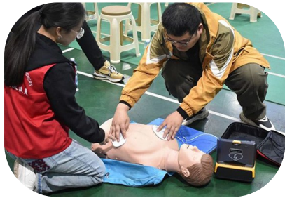
4月9日,西山煤电工会职工安全健康素质培训暨群监网员培训在西曲矿举办,来自古交矿区的