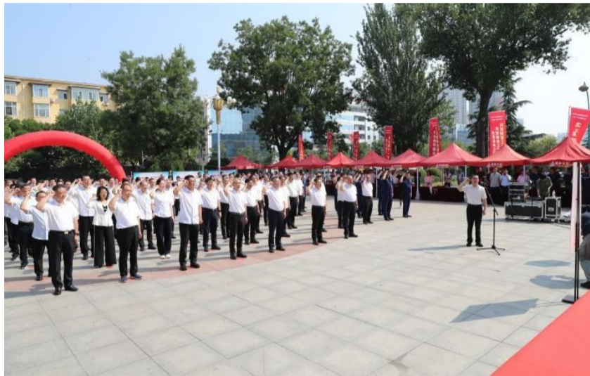
6月16日,山西焦煤西山煤电在西山体育馆广场开展“安全宣传咨询日”活动。公司领导、专业技术委员会副主任,以及机关部门、共享中心、事业部、